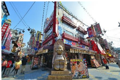
改装前の「日本一の串かつ 横綱」外観