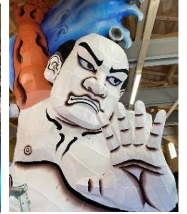
「浪速の灯火」制作風景