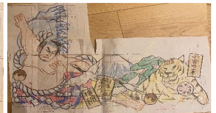
「浪速の灯火」動物園側デザイン