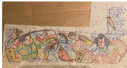
「浪速の灯火」通天閣側デザイン